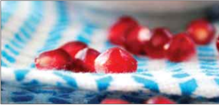
از دانه‌های انار تسبیحی برای می‌سازم تا در لحظه‌های قنوت بوزم